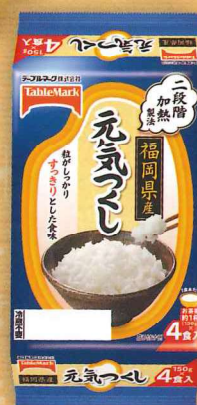
福岡県産元気つき (分割)4食