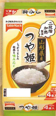
山形県産つや姫 (分割)4食