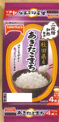
秋田県産あきたこまち (分割)4食