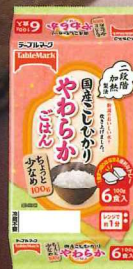
国産こしひかり やわらかごはん(分割)6食 600g(100g×2食×3個)