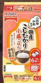
国産こしひかり 小盛ごはん(分割)6食 600g(100g×2食×3個)