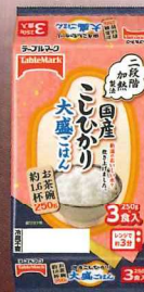
国産こしひかり 大盛ごはん3食 750g(250g×3食)