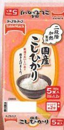
国産こしひかり 5食 900g(180g×5食)