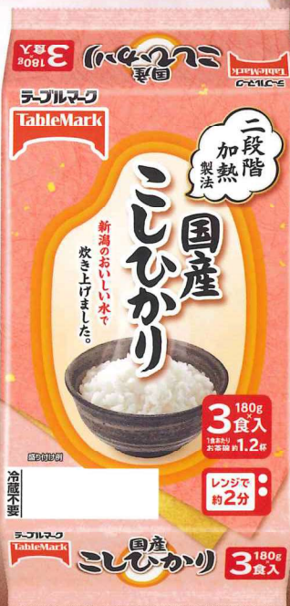
国産こしひかり 3食 540g(180g×3食)