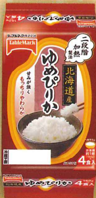
北海道産ゆめぴりか (分割)4食