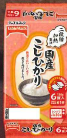
国産こしひかり (分割)6食 900g(150g×2食×3個)