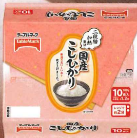
国産こしひかり 10食 1800g(180g×10食)