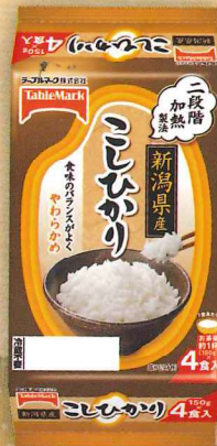
新潟県産こしひかり (分割)4食