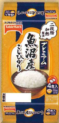
魚沼産こしひかり (分割)4食

人気の銘柄米を取り揃えた、テーブルマークのパックごはん「銘柄米シリーズ」。 銘柄米の確かなおいしさを、レンジで加熱するだけでお楽しみいただけます。